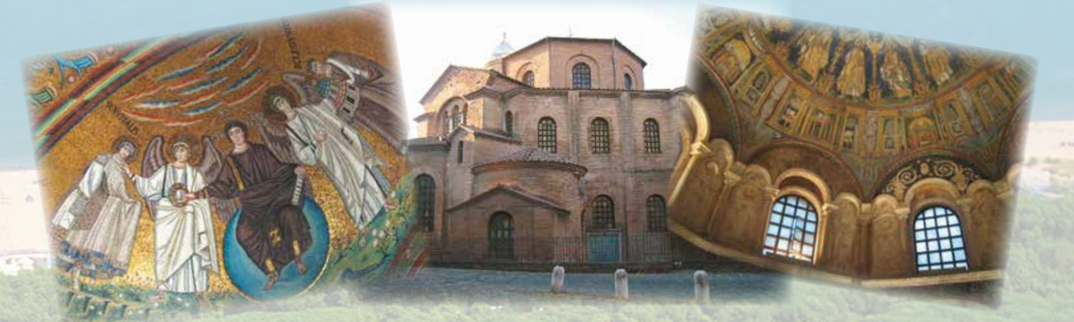
Ravenna, città d'arte e cultura bizantina, dichiarata dall'Unesco Patrimonio dell'Umanità (8 km) Ravenna, famous for its byzantine treasures, a Unesco World heritage site