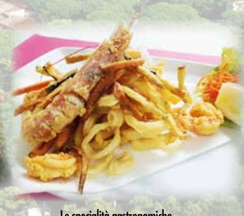
Le specialità gastronomiche Gastronomical traditions