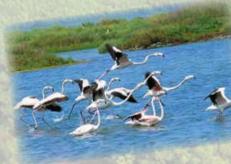
Birdwatching nel parco del Delta del Po Birdwatching in the Po Delta Park