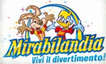
A soli 15 minuti da Mirabilandia, uno dei parchi divertimento più belli e divertenti d'Europa Just 15 min. far from Mirabilandia, one of the best and most amusing fun parks all over Europe