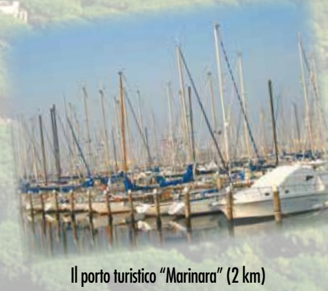
Il porto turistico "Marinara" (2 km) The port for tourists "Marinara"