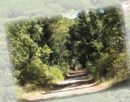
La pineta, ideale per mantenersi in forma (0,00 km) The pinewood, ideal for jogging