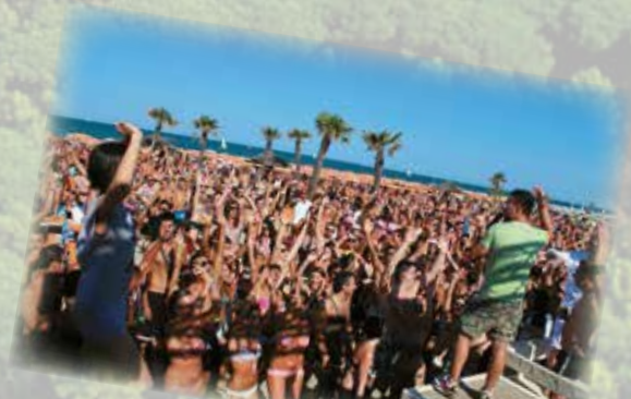
Feste sulla spiaggia Parties on the beach